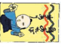
例) 角あれば歩あり ( 楽あれば苦あり)

野老澤行灯廊火では多数の地口行灯が並びます。 地口行灯とは、諺(ことわざ)や有名な芝居の台 詞などをダジャルでもじって、それに合った面白 い絵をつけた行灯のことです。 ぜひお気に入りの地口行灯をみつけてください。